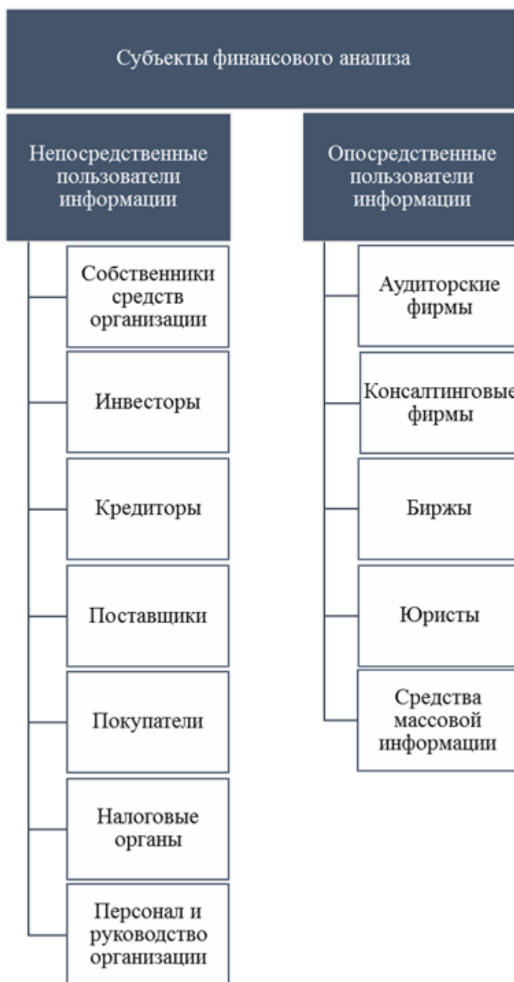
Рисунок 1 – Субъекты финансового анализа

пользователи информации. Более подробно субъекты финансового анализа представлены на рисунке 1.