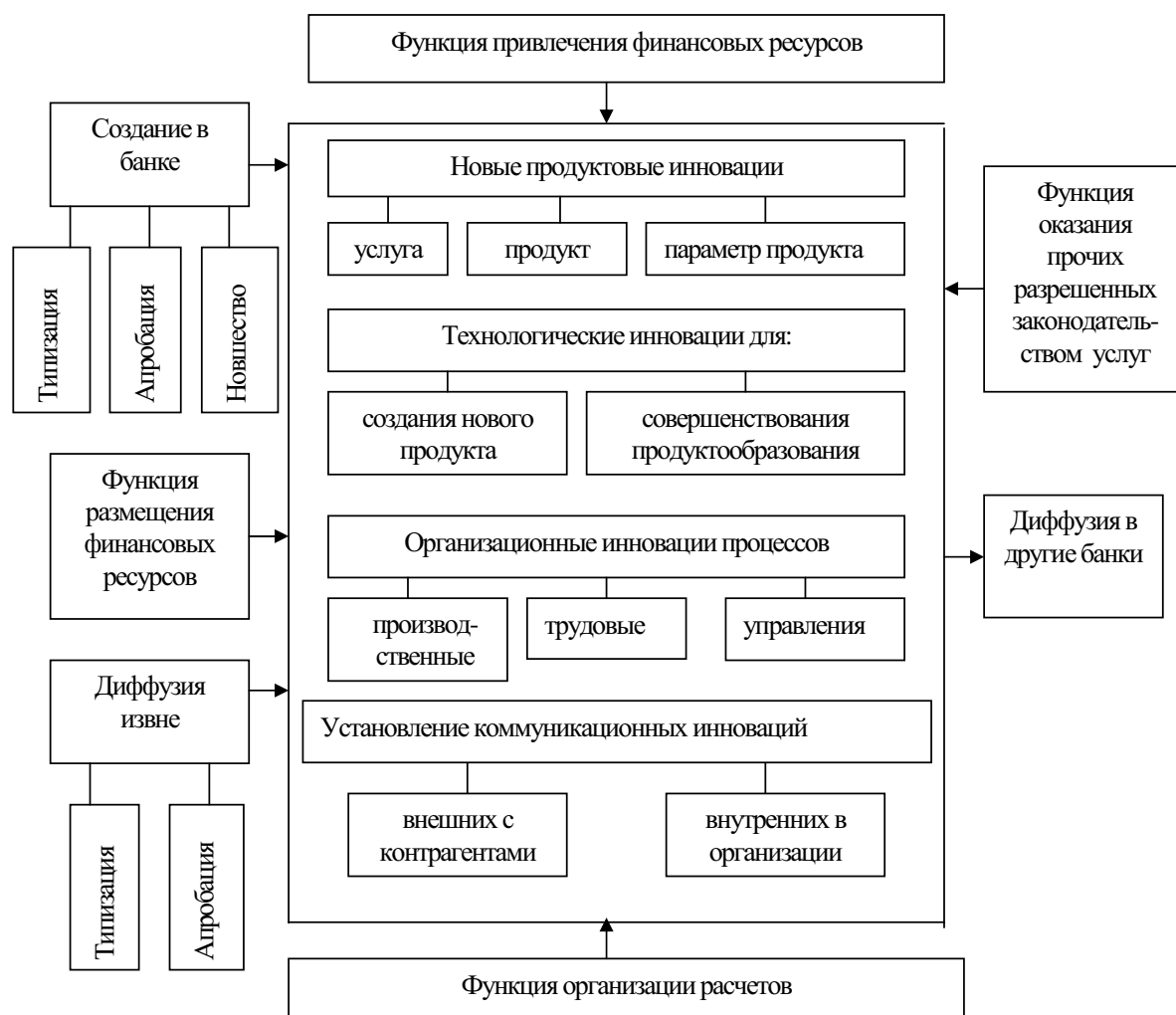
Рис. 1. Классификация банковских инноваций

Логика выделения трех уровней подструктур в структуре способности к труду позволяет при орга-