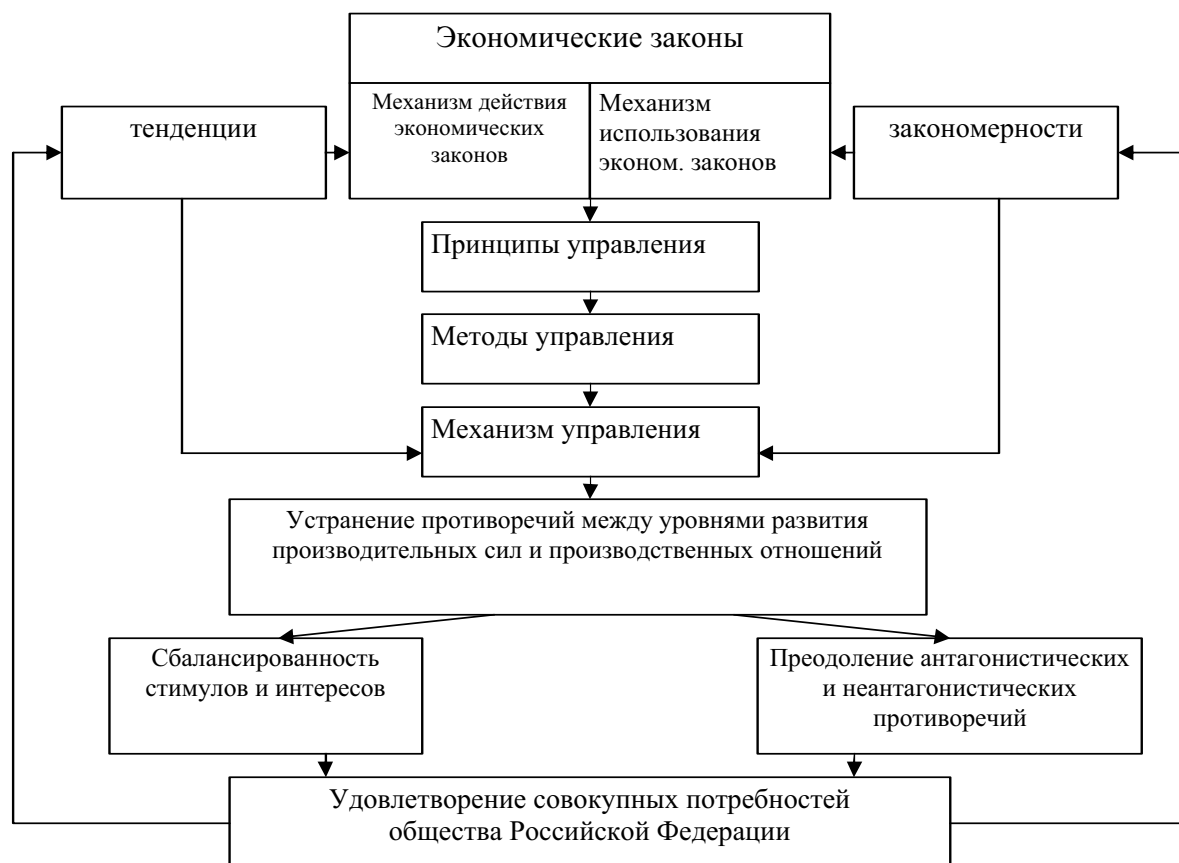
Рис. 2. Методология формирования новой двухполюсной системы управления социально-экономическим развитием России

водства, экономии времени и опережающих темпов роста продуктов труда над заработной платой, социальной и правовой справедливости и др. Все это, в конечном счете, направлено на сбалансированность социально-экономического развития страны, развитие экономики страны как целого и преодоление антагонистических и неантагонистических противоречий по удовлетворению совокупных потребностей общества РФ в новой системе управления (рис. 2).