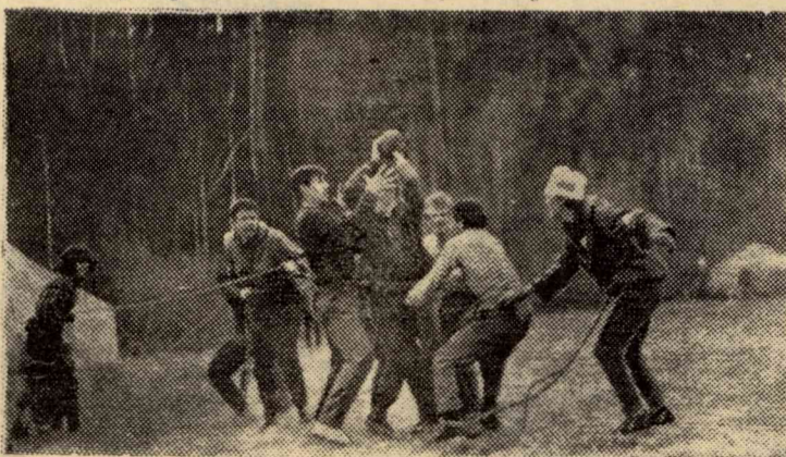
Шуточный матч входил в программу слета.