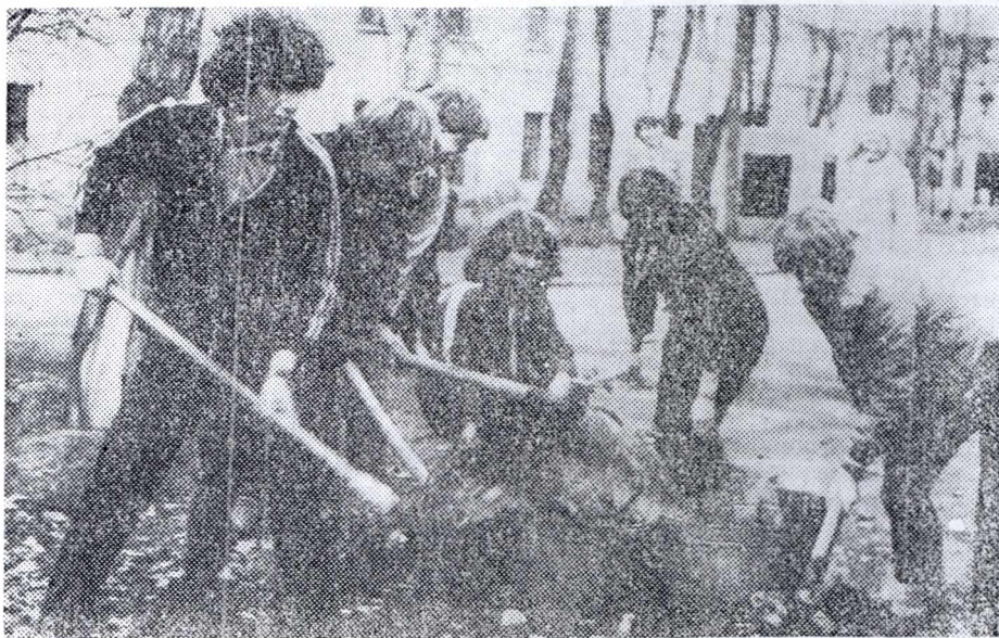
НА СНИМКЕ: студенты химико-технологического факультета на субботнике.

С высокой производи- тельностью труда на эконо- мном сырье работа- ли высококвалифицирован- ные специалисты ЭИМ. В механическом цехе, на- стоят 4 бригады. Одна — (Окончание на 2-й стр.)