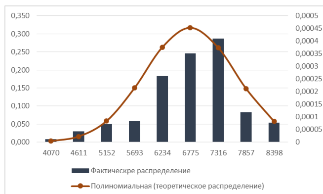
Рис. 2. Гистограмма фактического и теоретического нормального распределений

По результатам расчета была построена гистограмма распределения относительных частот, изображенная на рисунке 2, по ее виду была выдвинута гипотеза о том, что закон распределения является нормальным.